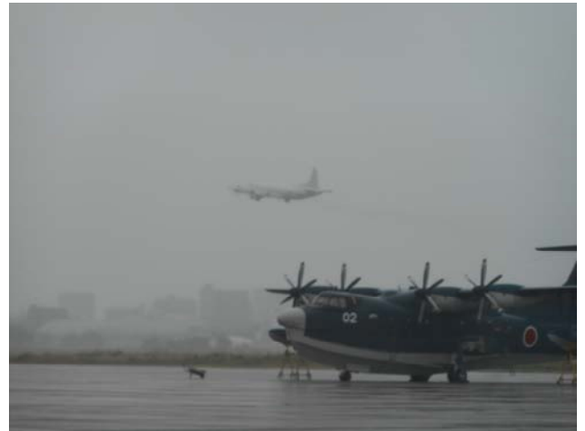
離陸し、出国する P-3C 哨戒機