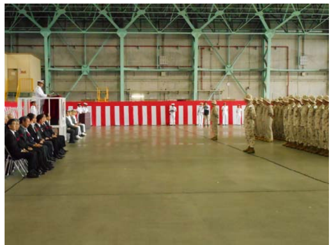
派遣隊員に訓示を行う佐藤航空集団司令官