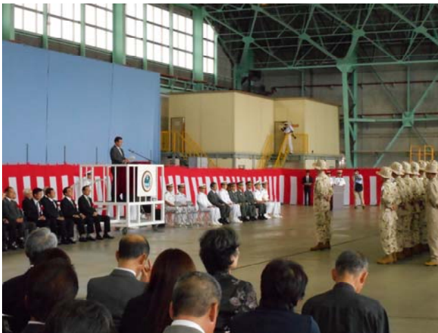
大内司令ほか派遣隊員の方々に訓示を行う原田防衛大臣政務官