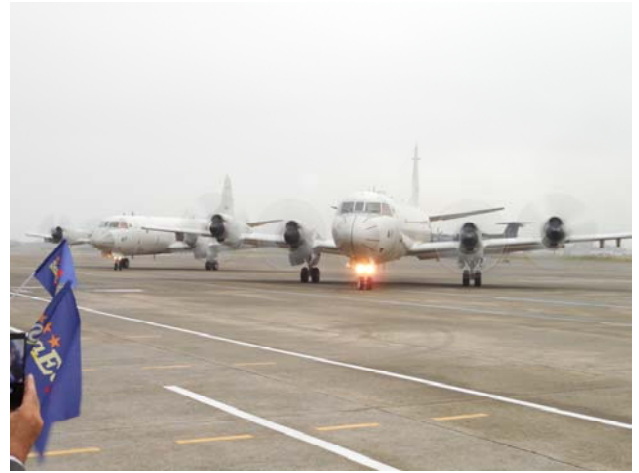
離陸のため滑走路へ移動する P3C 哨戒機