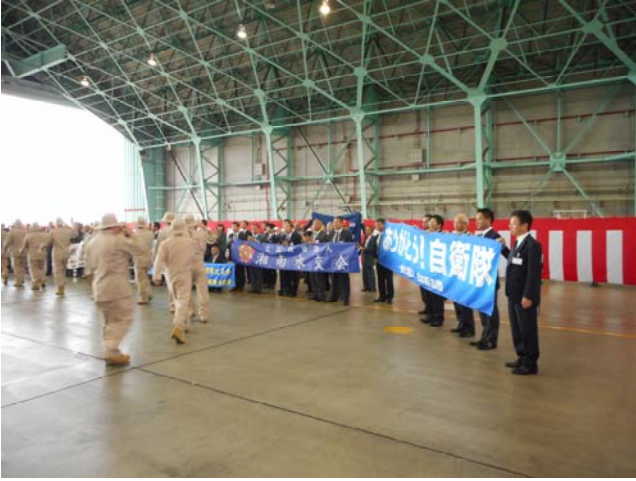
出国のため移動を開始する派遣隊員の方々