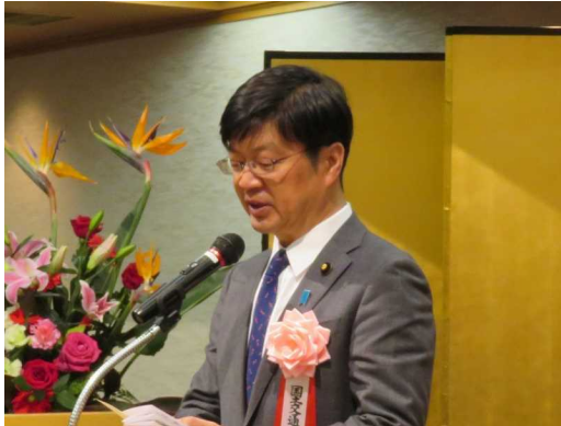
阿達雅志国土交通大臣政務官