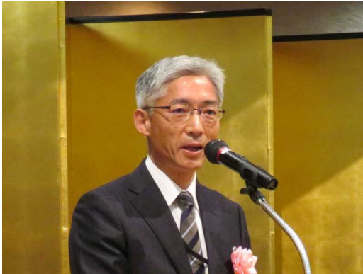
岩並海上保安庁長官