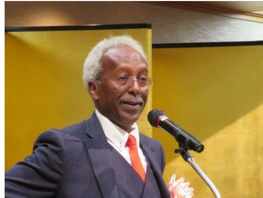
アホメド・アライタ・アリ駐日特命全権大使