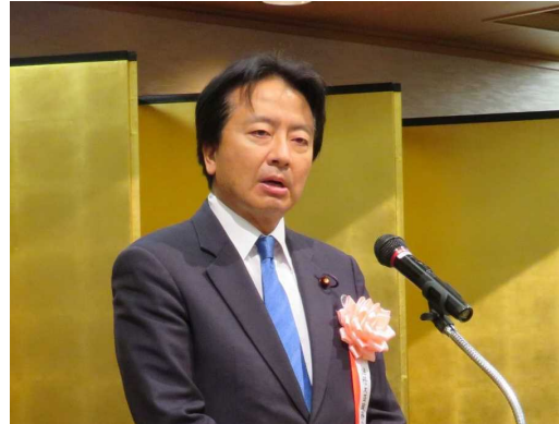
門山宏哲法務大臣政務官