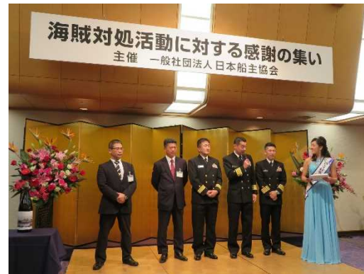
ミス日本「海の日」によるインタビュー