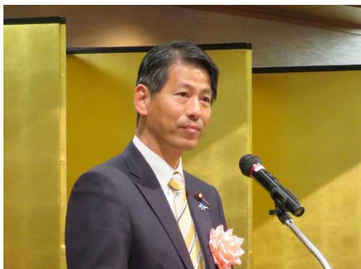
山田賢司外務大臣政務官