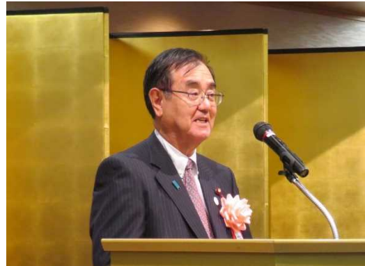
原田憲治防衛副大臣