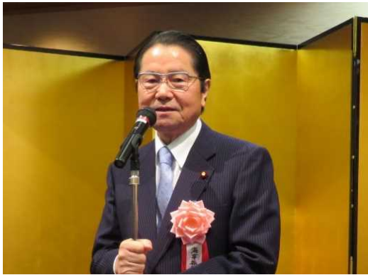
衛藤海事振興連盟会長