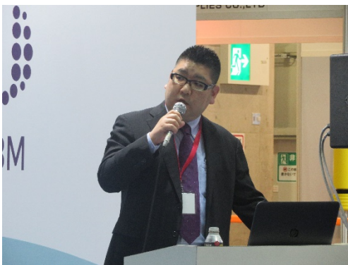
▲当協会 大森海務部課長

当協会では、今後も日々の生活を支える海運を広く知っていただくための活動を実施してまいります。