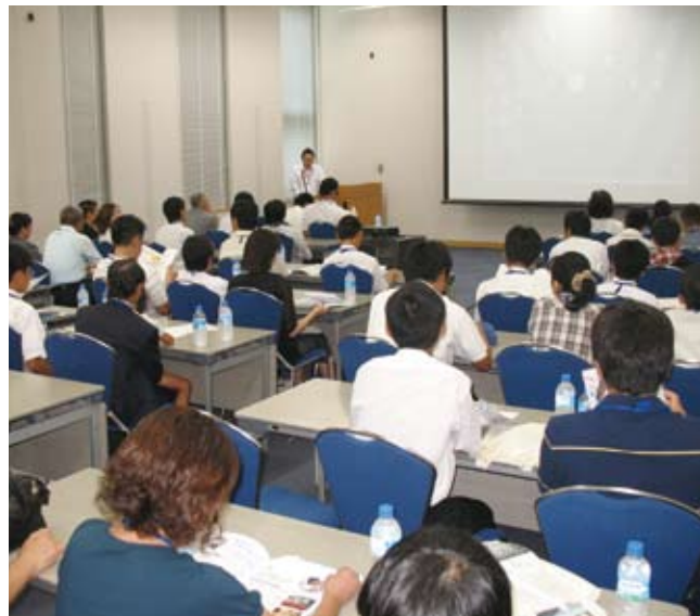
昨年度のガイダンスの様子

商船学科のある国立高等専門学校は、全国に5校「富山（富山県）、鳥羽（三重県）、広島（広島県）、大島（山口県）、弓削（愛媛県）」あります。5年半にわたる一貫した教育システムにより高い水準の専門知識を身につけることができ、卒業時には準学士の称号が与えられます。就職率はきわめて高く、一流企業をはじめ官公庁等からの求人も多く、 希望する学生の100%が就職 を果たしています。また卒業後に大学の3年次へ編入学することもできます。