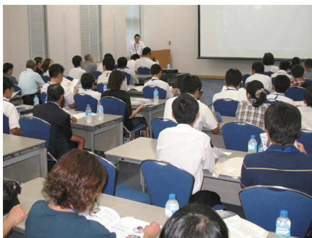
ガイダンスの様子

一流企業をはじめ官公庁等からの求人も多く、また、卒業後に大学の3年次へ編入学することもできます。