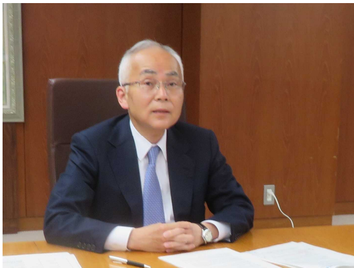
●ASA 第 30 回年次総会（オンライン）会合風景