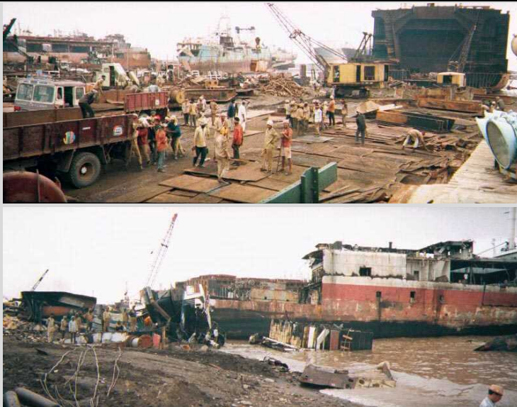
[1994年] 雑然とした解体現場。環境・労働安全対策は不十分で、汚染は至るところに見られた。