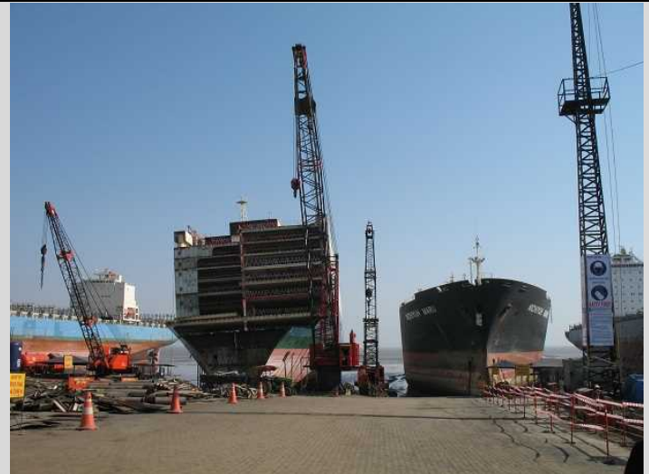
[2017年] 作業区画の整理、非浸透性コンクリート床、ドレン溝の設置。作業者は保護具を着用。