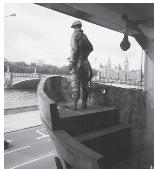
IMO本部正面にあるオブジェ