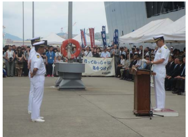
派遣隊員に自衛艦隊司令官の訓示を代読する山村護衛艦隊司令官