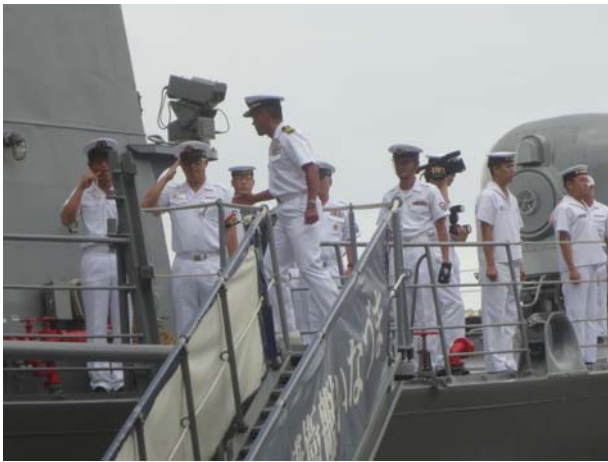
「いなづま」へ乗艦する派遣隊員