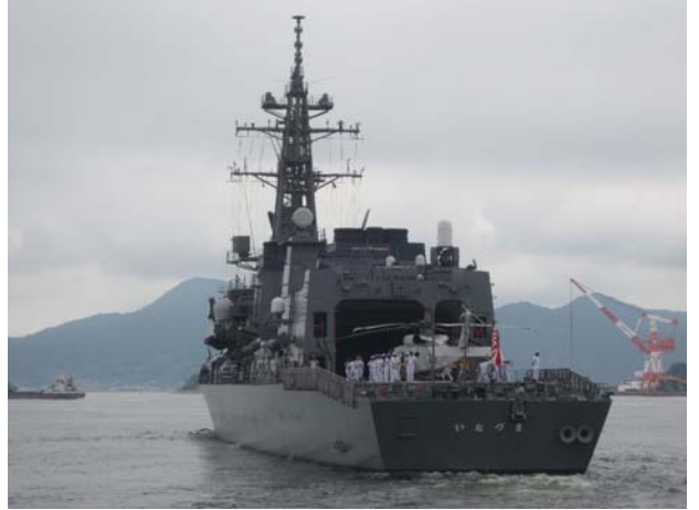
出港する「いなづま」