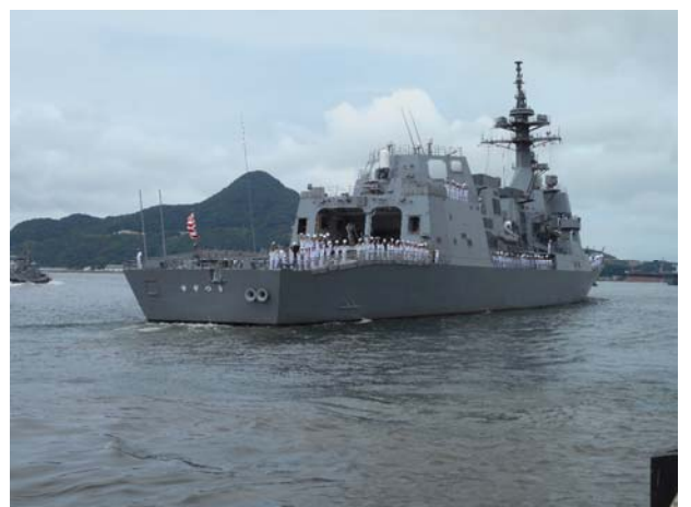
出港する「すずつき」