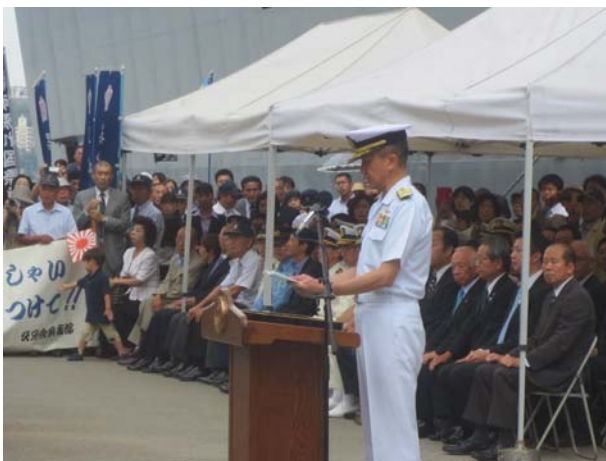
派遣隊員に防衛大臣訓示を代読する池呉地方総監