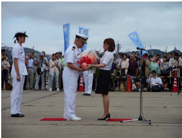
日本船主協会から「すずつき」艦長へ花束贈呈