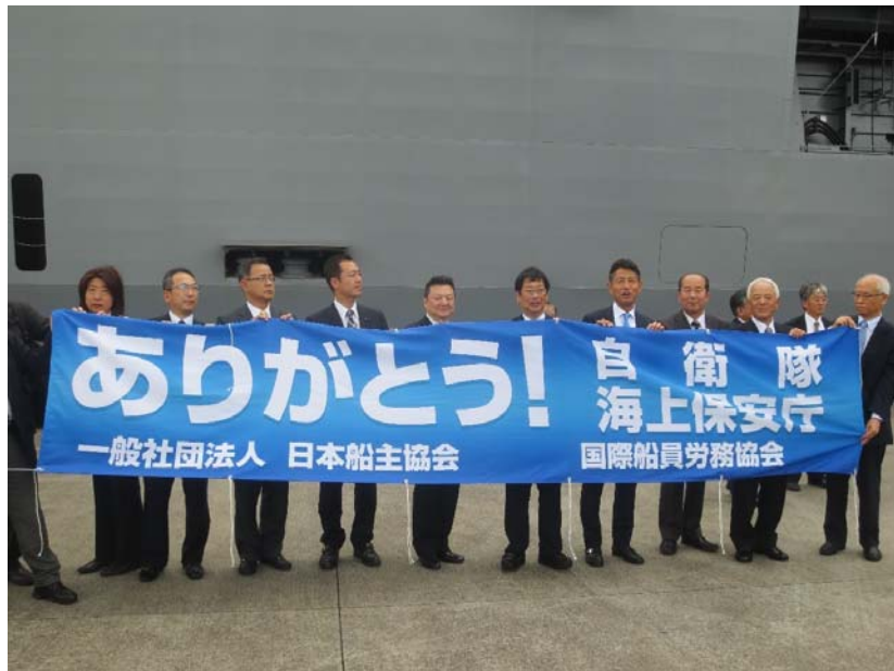
横断幕を持ち、護衛艦を見送る日本船主協会関係者