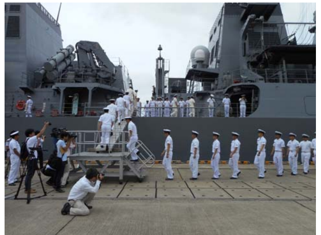
「すずつき」へ乗艦する派遣隊員