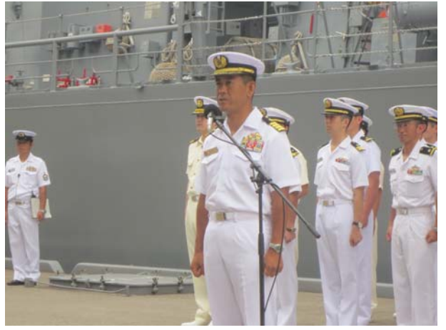
出国報告をする第4護衛隊司令