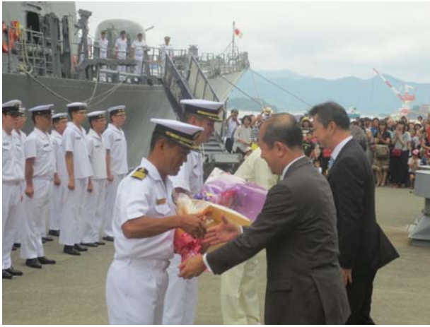
日本船主協会から第4護衛隊司令へ花束贈呈