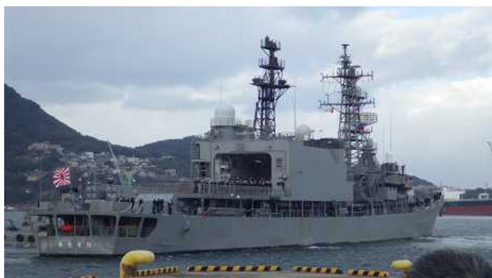
入港する護衛艦「あまぎり」