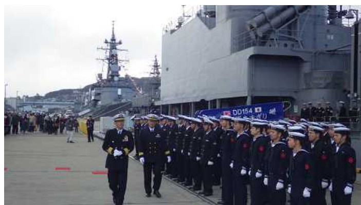
下船する派遣隊員