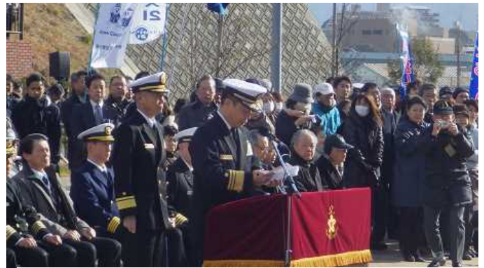
派遣隊員に訓示する山下自衛艦隊司令官