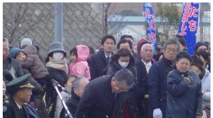
出迎いの挨拶をされる赤峯国際船員労務協会会長