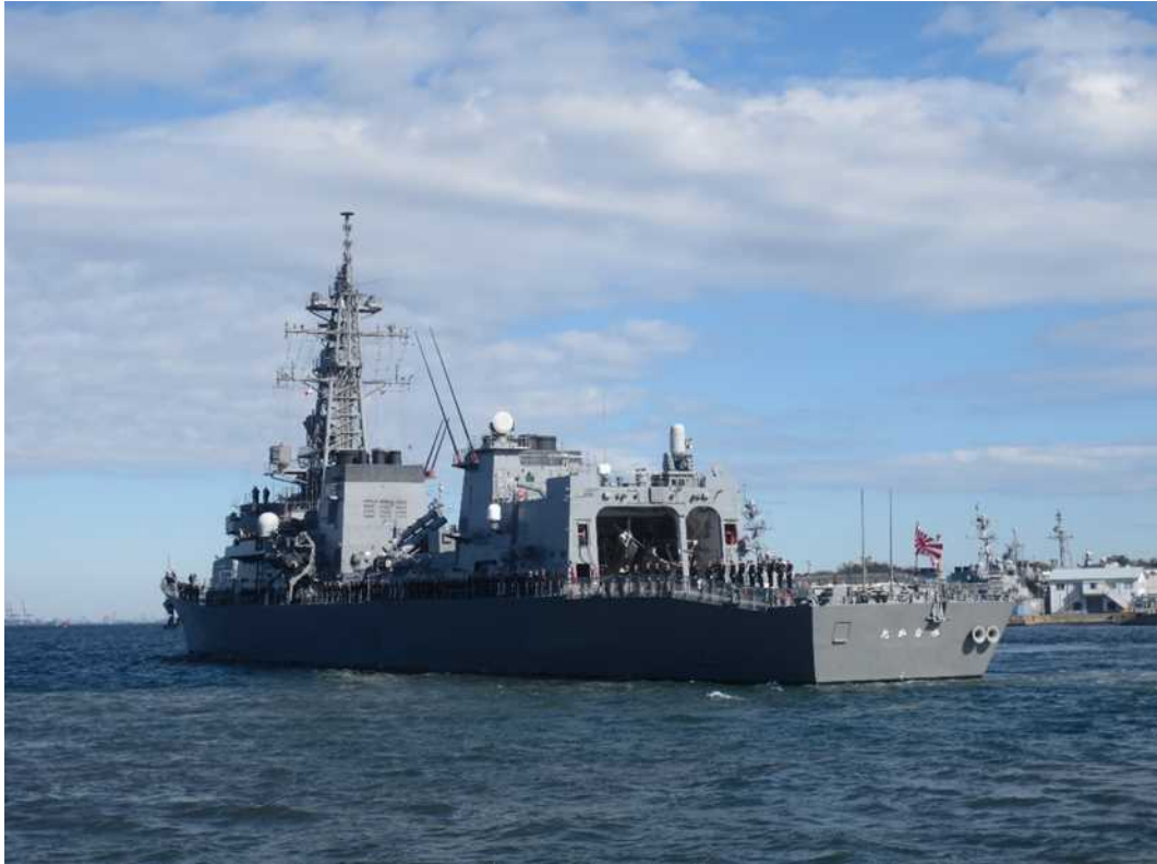
出航する護衛艦「たかなみ」