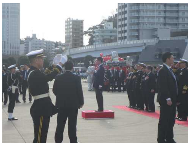
荣誉礼を受ける河野防衛大臣