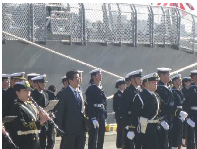
巡閲中の安倍総理大臣