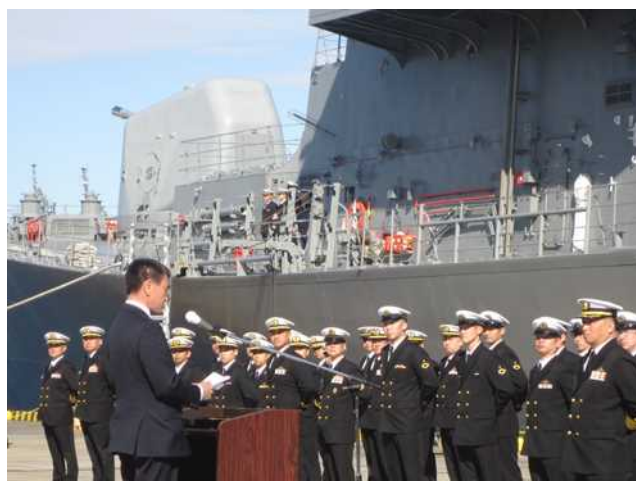
訓示する河野防衛大臣