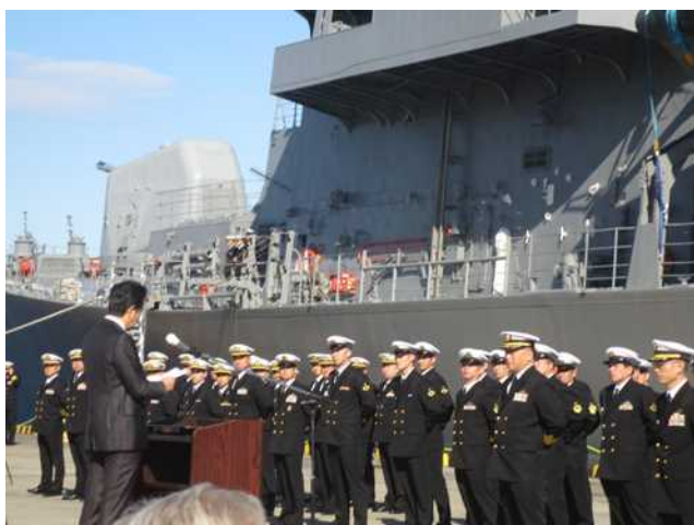
訓示する安倍総理大臣