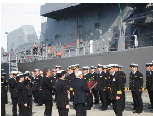
横須賀市長他による花束贈呈