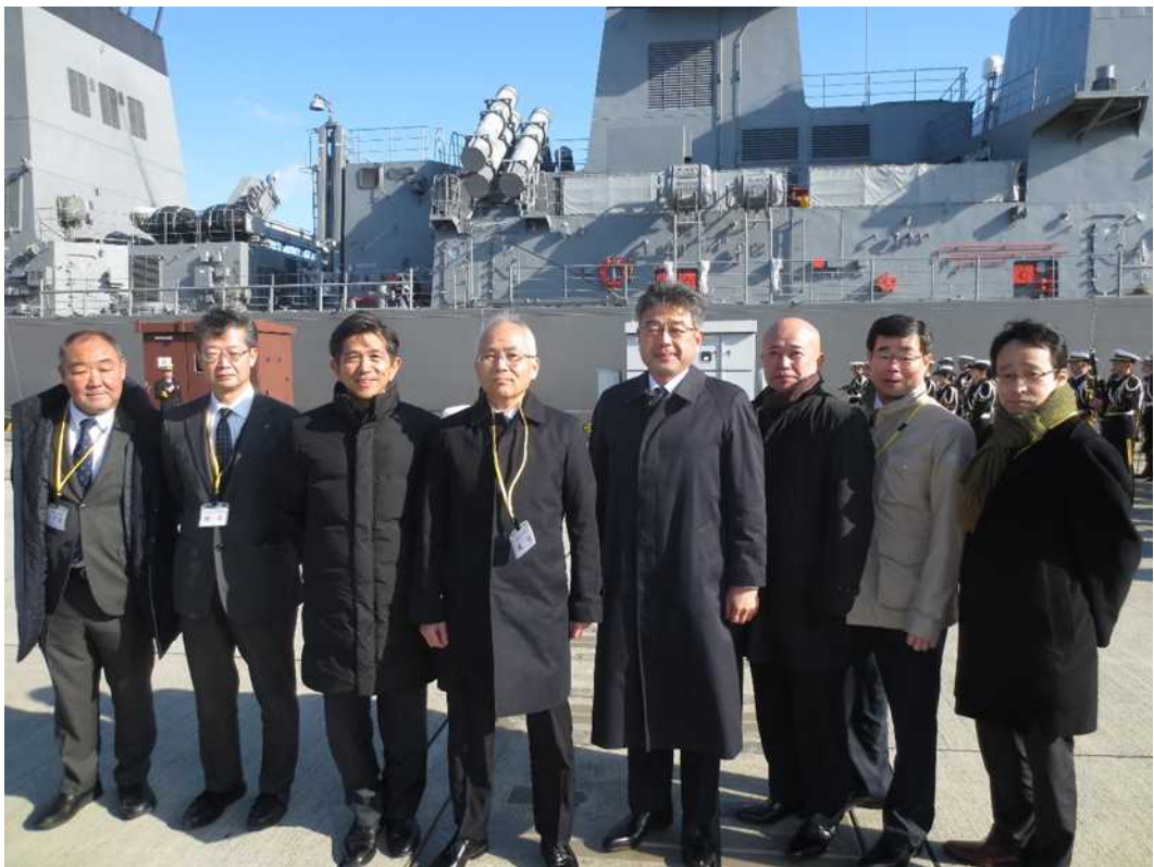
今回参加した協会関係者