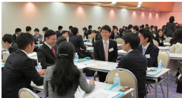
3 マナー研修 グループワーク実施中