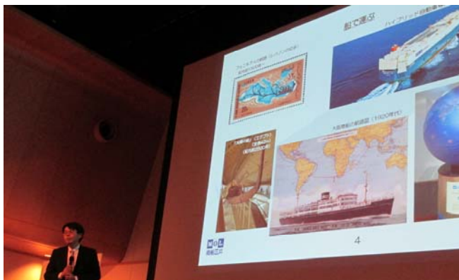
講演 4 中野講師