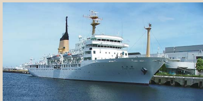
独立行政法人航海訓練所所属 銀河丸(6,185総トン) = 東京会場・神戸会場

一流企業をはじめ官公庁等からの求人も多く、また卒業後に大学の3年次へ編入学することもできます。