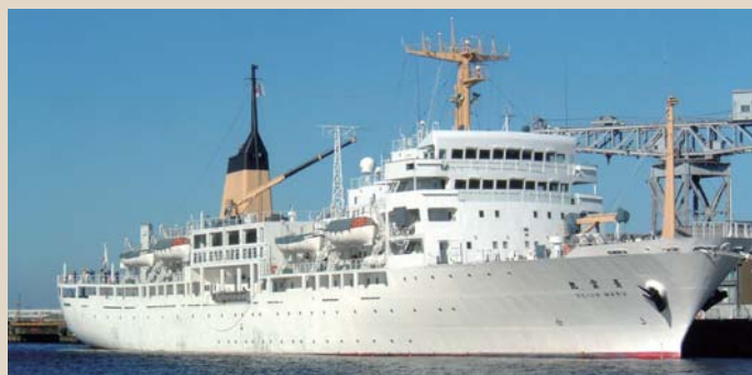
独立行政法人航海訓練所所属 青雲丸(5,890総トン)＝神戸会場

貿易立国、技術立国の日本を支え、広く世界へ、未来へと羽ばたく国際性豊かなたくましい若者を育てています。商船学科のある国立高等専門学校は、全国に5校「富山(富山県)、鳥羽(三重県)、広島(広島県)、大島(山口県)、弓削(愛媛県)」あります。5年半にわたる一貫した教育システムにより高い水準の専門知識を身につけることができ、卒業時には準学士の称号が与えられます。外航海運会社などの一流企業をはじめ官公庁等からの求人も多く、また、三級の海技免状を必要とする国内の長距離フェリー会社でも活躍することができます。なお、卒業後に大学の3年次に進学することもできます。